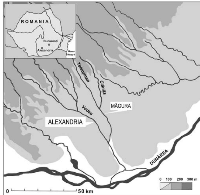
1. Comuna Măgura. Amplasarea geografică. Location of Măgura village